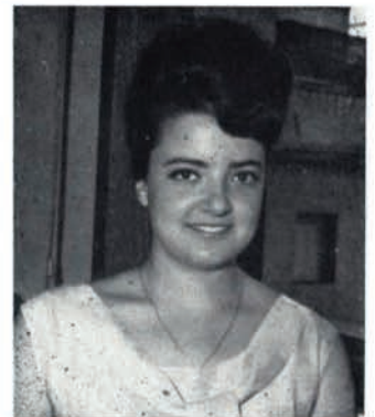
CONSEJO CERVERA (Recepción Camps y Fabrés)

—Me gusta leer la revista. No es ni muy buena, ni muy mala.