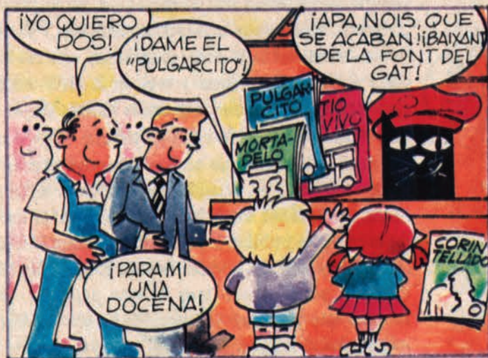
ERA EDITORIAL BRUGUERA UNA EMPRESA CON SOLERA