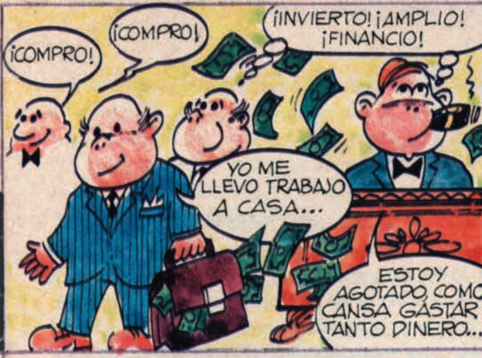
CONTRATAN EJECUTIVOS AUDACES E HIPERACTIVOS