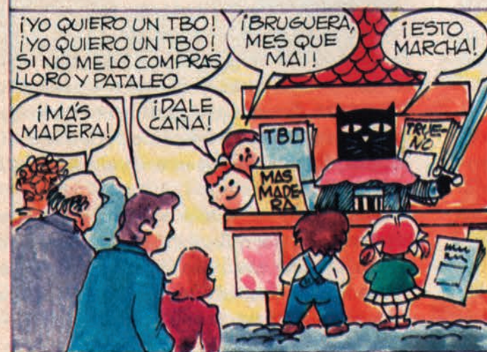
PUSIMOS NUESTRO DINERO NUESTRO SUDOR Y SAL-ERO