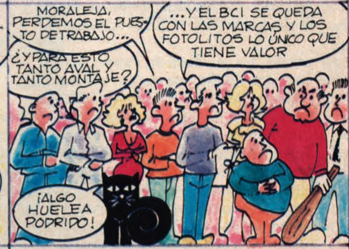
¡YÁ NO QUIEREN SABER NADA! ¿VAN CAPTANDO LA JUGADA?