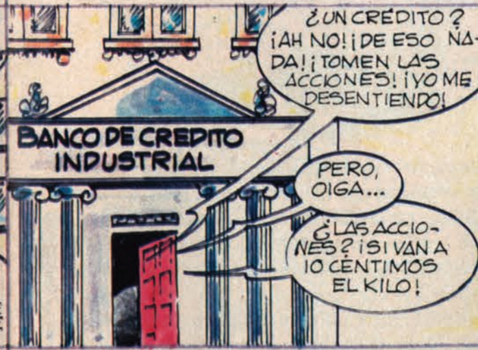
¡...PERO NOS DA EL B.C.I. CON LA PUERTA EN LA "NARI"!