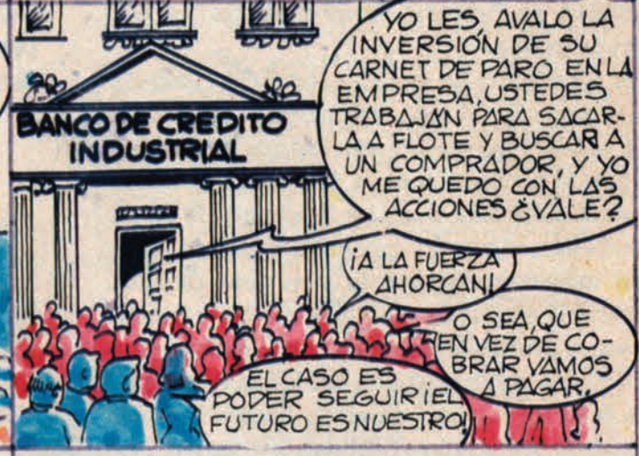
PUES LA QUIEBRA ERA INMINENTE TUVIMOS QUE SER VALIENTES