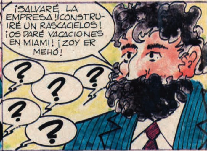
POCO DESPUES VINO EL LEO CON UN ROLLO MACABEO