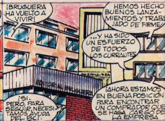
LLEGAMOS CASI AL PRESENTE, Y UN FUTURO SE PRESIENTE...