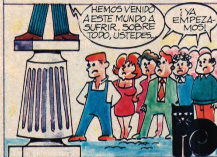
CONGELACION DE SALARIOS, BAJAS, DEUDA... ¡QUE CALVARIO!