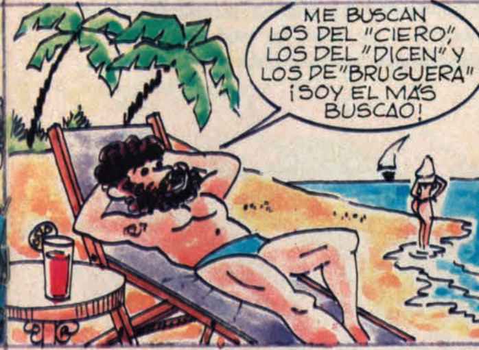
ERA UN TIPO "MACANUDO" SE LARGO CON LO QUE PUDO...