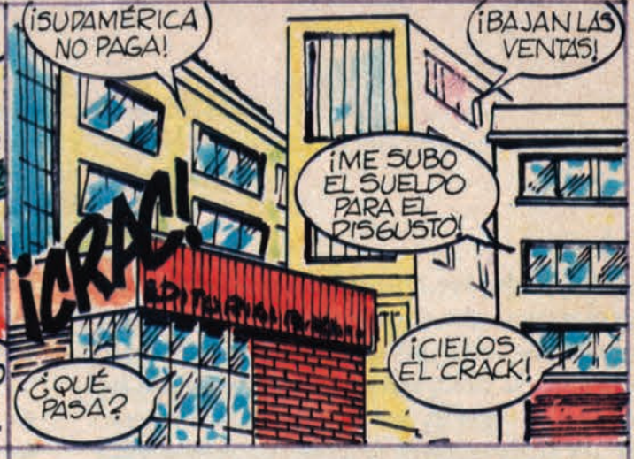
QUE SE PULEN LOS MILLONES Y EMPEZARON LOS FOLLONES