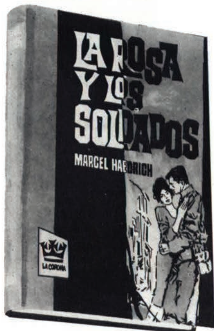
«La Corona». ¡Qué difícil compaginar la calidad con lo comercial!