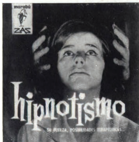
Marabú ZAS: Más de 300 títulos en preparación.