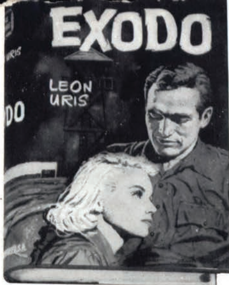
¡Este ha sido el gran éxito del departamento! EXODO, de León Uris: 125.000 ejemplares