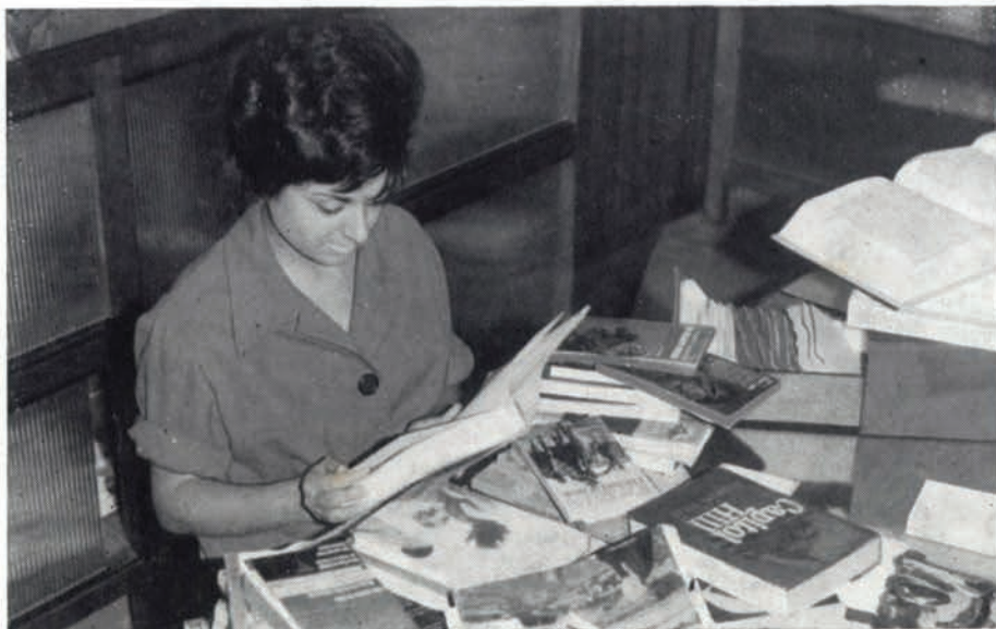
Primer trabajo: Selección de las obras recibidas

—¿Alguna novela importante en preparación?